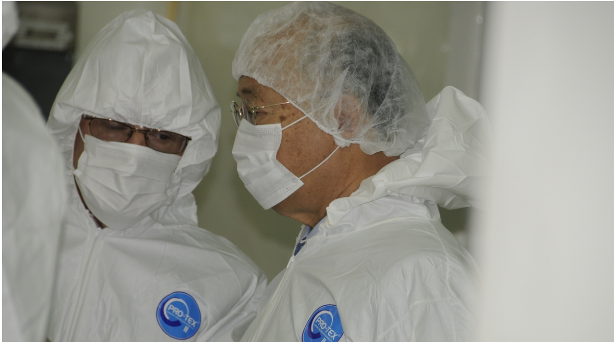
En la Planta de Producción de Radioisótopos