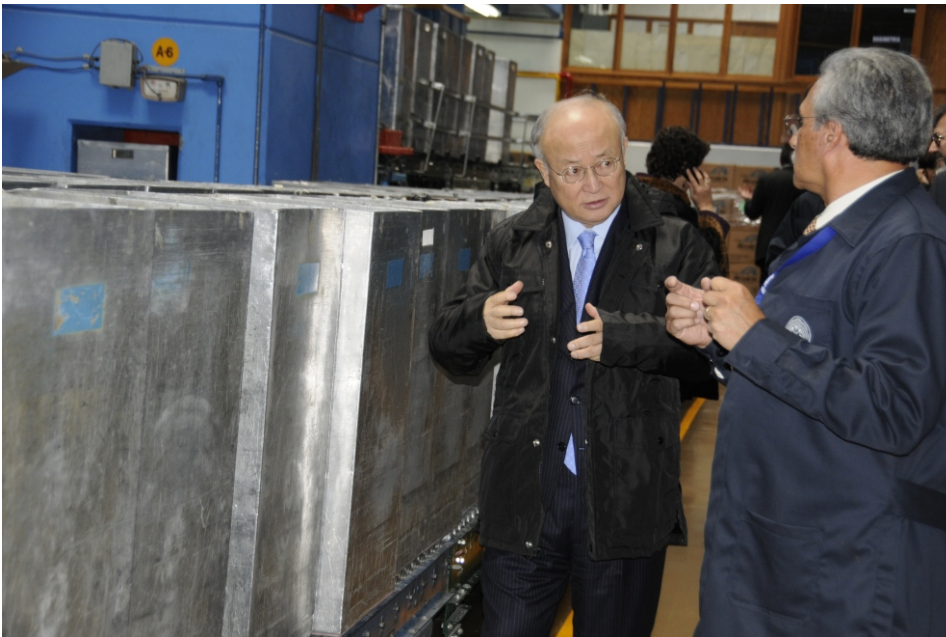
En la Planta de Irradiación Gamma

Amano realizó un recorrido por las instalaciones del Instituto Nacional de Investigaciones Nucleares (ININ) en la que visitó el reactor TRIGA Mark III, la Planta de Producción de Radiosótopos, la Planta de Irradiación Gamma, el acelerador de partículas Tandetrón, el Banco de Tejidos Radioesterilizados, y los laboratorios de Celdas Calientes y Microscopía Electrónica.